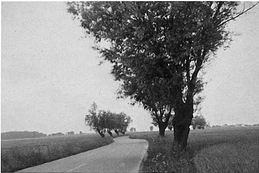
En pilallé på Söderslött

Så såg det ut uppe i Sverige och så såg det ut här i Skåne. Man får förmoda, att flertalet av våra s.k. snapphanegravar — fyrkantiga fördjupningar i jorden — egentligen är rester av gamla husgrunder vilka ödelagts genom "swartholm dödhe". Ännu idag återfinner vi dessa lämningar i Skånes villande skog.